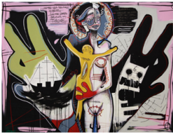
ELISABETH - 2015 - ACRYL , KREIDE AUF LEINWAND - 180X240CM