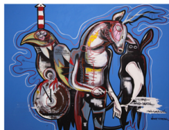
LIFE AND DEATH - 2015 - ACRYL, KREIDEAUF LEINWAND - 180X240CM