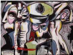
DER PAKT - 2015 - ACRYL, KREIDE AUF LEINWAND - 180X240CM