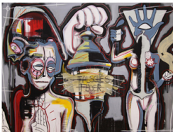
FALSCHES FEUER - 2015 - ACRYL, KREIDEAUF LEINWAND - 180X240CM