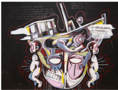
DIE VERSCHWÖRER - 2015 - ACRYL, KREIDE AUF LEINWAND - 180X240CM